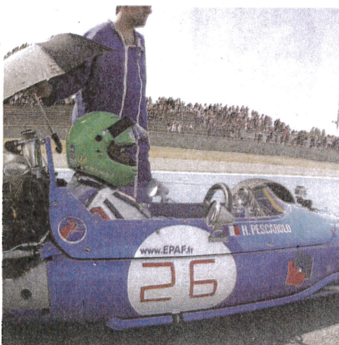
Henri Pescarolo, à Nogaro au grand prix historique de 2012 avec sa Mafra F1 de 1968

le de mort. Amnesty tional appelle à un ras- ment contre la peine de :samedi à Auch à 11 sur l'escalier des allées 7. En 2014, communique y, « 22 pays ont procédé écutions (Chine, Iran, aoudite, Etats Unis...) ys et territoires cont- t à la peine de mort fic de drogue. 13 de ces t procédé à des exéc- ur ce trafic. En 2014 et eine de mort a été abo- deux états des États- nnecticut et Nebraska) à Madagascar, au Suri- îles Fidji. La peine de :tue pas le trafic de dro-